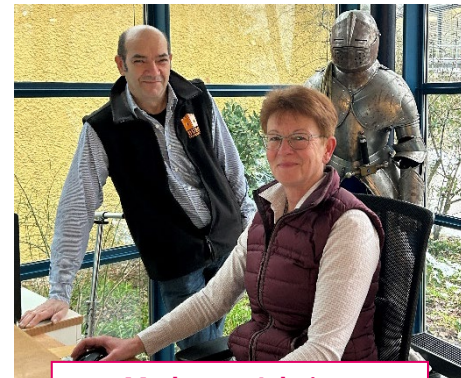
Modernes Arbeiten im Team

ALLER GUTEN DINGE SIND DREI: Deswegen suchen wir Sie als drittes Teammitglied für unsere Rezeption des Bildungszentrums Burg Schwaneck in Pullach im Isartal. Das Bildungszentrum Burg Schwaneck ist nicht nur wegen den historischen Räumen ein spannender Arbeitsplatz: Es ist ein lebendiger und bunter Begegnungsort, an dem Umwelt-, politisch-historische und interkulturelle Bildung aufeinandertreffen.