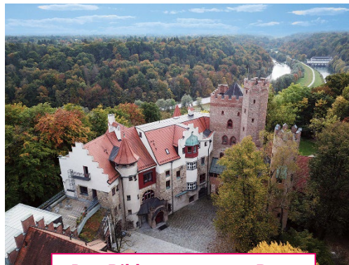
Das Bildungszentrum Burg Schwaneck von oben